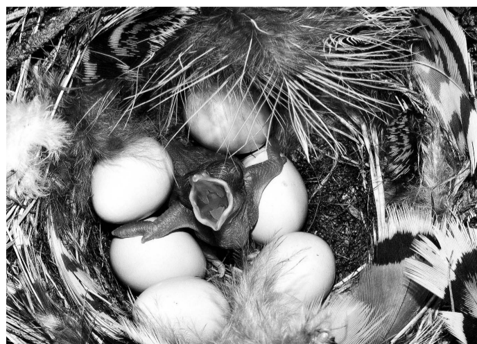
ZABIJÁK. Právě vyhlá kukačka se chystá zlikvidovat nevlastní sourozence.

Výzkum se uskutečnil v rámci mezinárodního projektu, který se snaží objasnit vztahy mezi hnízdními parazity a jejich hostiteli i na molekulární a mikroskopické úrovni. Tomáš Grim je prvním českým vědcem, jehož projekt je sponzorován prestižní nadací Human Frontier Science Program. Grim působí na katedře zoologie Přírodovědecké fakulty Univerzity Palackého v Olomouci od roku 1997, od roku 1994 se věnuje výzkumu ptáků a zejména životu kukaček. (paš)