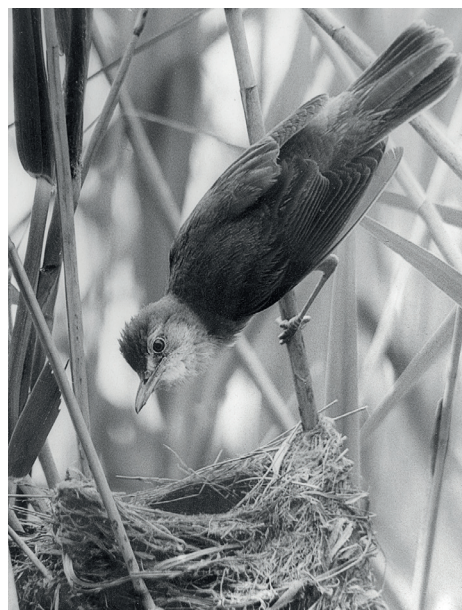
Rákosníci mi ukázali cestu ke kukačce

Jedním z nejsilnějších zážitků, které jsem v přírodě prožil, byla možnost vidět poprvé parazitaci kukačkou, tehdy na hníždě rákosníka velkého. A krásných okamžiků bylo tolik, že by na to tady nebyl prostor. Měl jsem to štěstí, že jsem procestoval celou Evropu. Třeba takový polární den je obrovský zážitek (tedy ten první, který prožíváte, pak si na to pomalu zvyknete). A rád se vracím právě na sever Evropy.