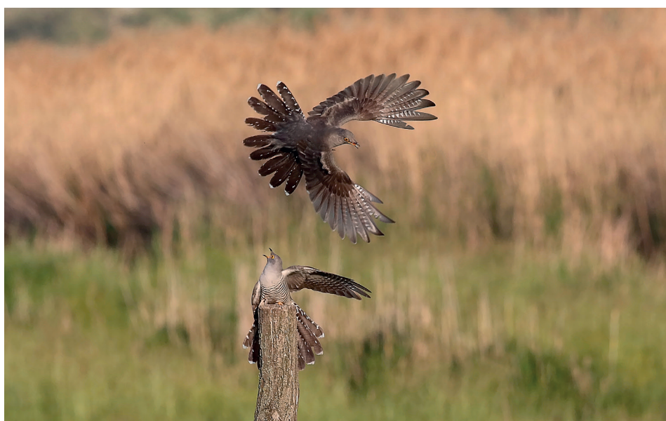
Kukaččí samci svádějí o teritorium urputné boje, které jsou však k zhlédnutí jen zřídka