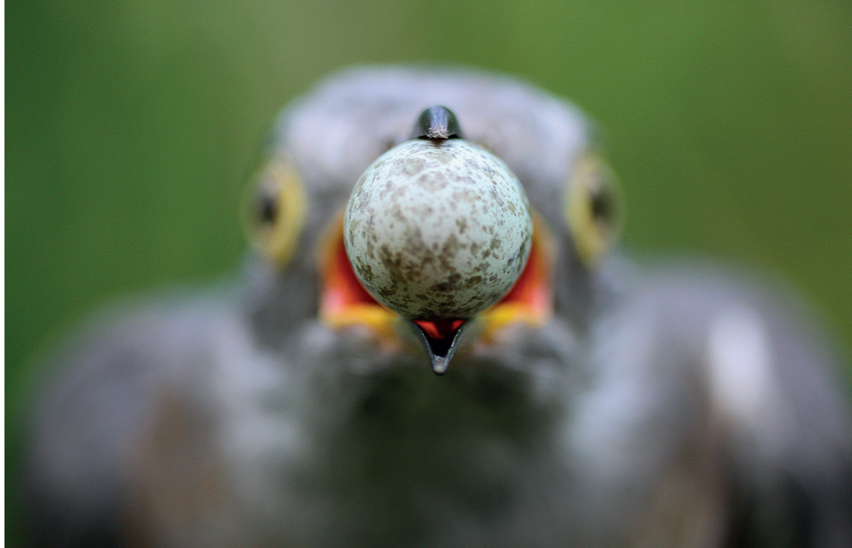
Vítězství a prohra – vítězný snímek soutěže Evropský fotograf přírody 2011

Koncem osmdesátých let minulého století jsem byl svědkem jedné události, která do té doby nebyla popsána. Znal jsem jedno hnízdo rákosníka obecného, které bylo parazitováno kukačkou. V době, kdy kukaččí mládě bylo ve stádiu dvou týdnů, se odehrálo něco, čemu jsem ani nechtěl věřit. Rákosníci postupně v průběhu dne přestali kukačku krmít, začali rozebírat hnízdo pod mládětem a stavět dva metry odtud hnízdo nové. Mládě následně na hnízdě uhynulo. Tato kukaččí tragédie mi s nadsázkou změnila život a já se začal kukačce věnovat intenzivněji než dříve.