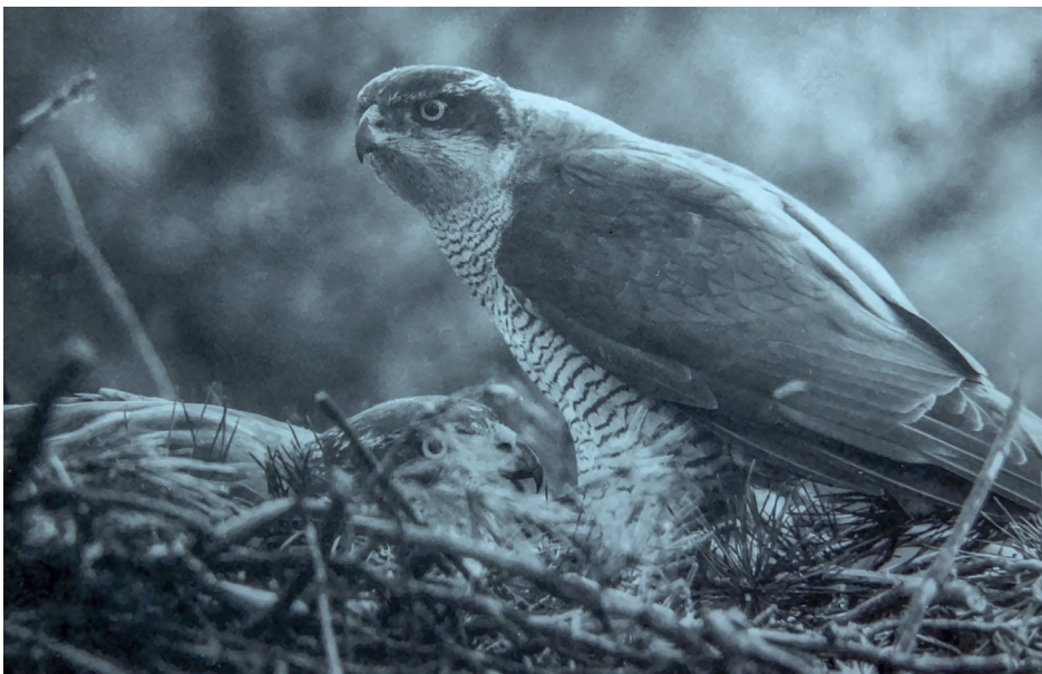
Jestřábi pár – velmi vzácná chvíle

Když mi bylo třináct, při jedné toulce s kamarády u nedalekých rybníků u okolí